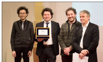
PREMIO CATEGORIA LITERATURE DESIGN "BILANCI PB GROUP"