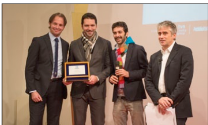
PREMIO CATEGORIA IDENTITY MANUAL "BRAND MANUAL MERCHANDISING GENOA"