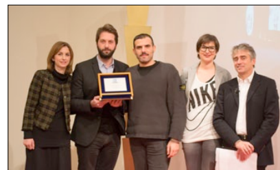
PREMIO CATEGORIA RETAIL DESIGN "JUVENTUS NIKE GAMEDAY & VIP STORE"