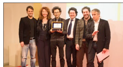
PREMIO CATEGORIA SYSTEM IDENTITY "ABI CONVEGNI 2012"