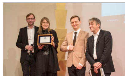
PREMIO CATEGORIA CORPORATE & BRAND IDENTITY "NEO"