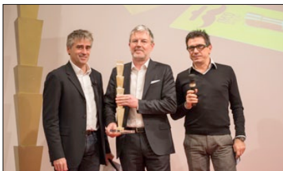
BRAND IDENTITY GRANDPRIX PREMIO CATEGORIA PRODUCT IDENTITY "NYCO&TYNA"

SI È SVOLTA A MILANO PRESSO CARTIERE VANNUCCI LA CERIMONIA DELLA DICOTTESIMA EDIZIONE DEL PREMIO ORGANIZZATO DA TVN MEDIA GROUP. L'EVENTO, PRESENTATO DA ANDREA PELLIZZARI, È STATO UN'OCCASIONE PER FARE IL PUNTO SULL'EVOLUZIONE DELLA COMUNICAZIONE DEL PRODOTTO IN TERMINI DI DESIGN E INNOVAZIONE DEL PACKAGING. A VINCERE IL BRAND IDENTITY GRANDPRIX È STATO IL PROGETTO NYCO&TYNA DI COOEE ITALIA PER I-PRODUCTS.