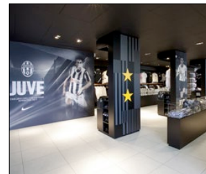
1° PREMIO CATEGORIA RETAIL DESIGN JUVENTUS NIKE GAMEDAY & VIP STORE AZIENDA: JUVENTUS MERCHANDISING AGENZIA: FUTUREBRAND