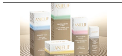
1° PREMIO CATEGORIA NAMING ANGELINI - ANJELIF AZIENDA: ACRAP AGENZIA: CARRÉ NOIR