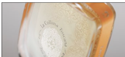
1° PREMIO CATEGORIA PACKAGING LUSO LA COLLINA TOSCANA E.D.P. NEW FRAGRANCES 2012 AZIENDA: ACQUACOSMETICS AGENZIA: ROBERTO BAI & UNITED DESIGNERS