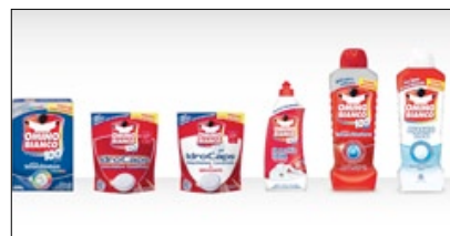
1° PREMIO CATEGORIA PACKAGING IGIENE CASA OMINO BIANCO AZIENDA BOLTON MANITOBA AGENZIA: LUMEN