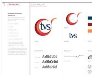
1° PREMIO CATEGORIA CORPORATE & BRAND IDENTITY TVS PENTOLE AZIENDA: TVS AGENZIA: LUMEN