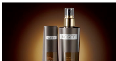
1° PREMIO CATEGORIA PACKAGING COSMESI KORFF AZIENDA: ISTITUTO GANASSINI AGENZIA: LUMEN