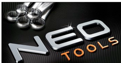
1° PREMIO CATEGORIA CORPORATE & BRAND IDENTITY NEO AZIENDA: GRUPA TOPEX AGENZIA: DRAGON ROUGE SP. Z O.O. (POLAND)