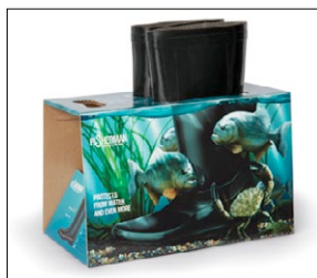
1° PREMIO CATEGORIA PACKAGING OWN & PRIVATE LABEL FISHERMAN AZIENDA: BOON AGENZIA: GOOD IDEA (ALMATY, KZ)