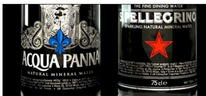
1° PREMIO CATEGORIA PACKAGING CELEBRATION ACQUA PANNA S.PELLEGRINO AZIENDA: NESTLÉ WATERS AGENZIA: ROSSETTI DESIGN