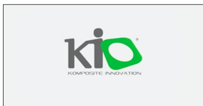
1° PREMIO CATEGORIA DIGITAL DESIGN KIO AZIENDA: INDUSTRIE POLIECO AGENZIA: COOEE ITALIA