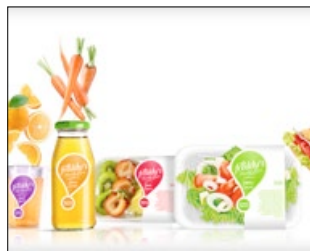
1° PREMIO CATEGORIA PACKAGING ALIMENTARI FREDDY'S, FRESHLY YOURS AZIENDA: SCHMIDT RETAIL CONCEPT AGENZIA: AMPRO DESIGN CONSULTANTS (ROMANIA)