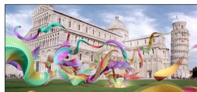
1° PREMIO CATEGORIA BROADCAST DESIGN AND GRAPHICS, INCL. ANIMATION SKY ARTE HD AZIENDA: SKY ITALIA AGENZIA: ANGELSIGN STUDIO