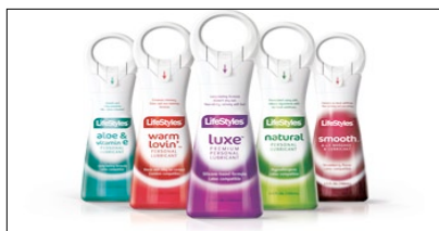
1° PREMIO CATEGORIA PACKAGING FARMACEUTICI LOVE AT FIRST SIGHT AZIENDA: ANSELL AGENZIA: REVERSE INNOVATION