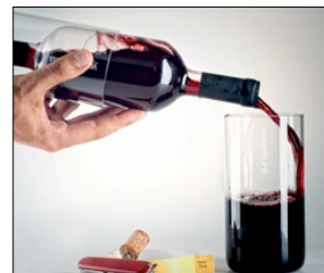
1° PREMIO CATEGORIA PACKAGING CELEBRATION THE WIN-WIN BOTTLE AGENZIA: AMPRO DESIGN CONSULTANTS (ROMANIA)