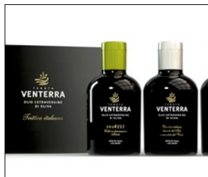
1° PREMIO CATEGORIA PACKAGING ALIMENTARI TENUTA VENTERRA AZIENDA: AZIENDA AGRICOLA ANTONELLA FERRARA AGENZIA: ROSSETTI DESIGN