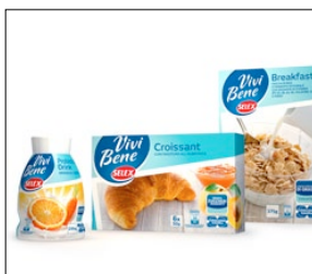
1° PREMIO CATEGORIA PACKAGING OWN & PRIVATE LABEL SELEX AZIENDA: SELEX GRUPPO COMMERCIALE AGENZIA: ROSSETTI DESIGN