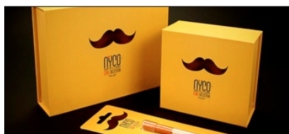
BRAND IDENTITY GRANDPRIX 2012 1° PREMIO CATEGORIA PRODUCT IDENTITY NYCO&TYNA AZIENDA: I-PRODUCTS AGENZIA: COOEE ITALIA

punto sull'evoluzione della comunicazione del prodotto in termini di design e innovazione del packaging. Durante la cerimonia è stato assegnato a Ugo Nespolo , pittore e scultore di fama internazionale, il Premio Arte e Culture della Comunicazione, riconoscimento a un uomo che ha saputo coniugare l'arte figurativa con altre forme di espressione, tra cui il cinema, il teatro, la letteratura e la comunicazione. L'evento è stato sponsorizzato da Depositphotos . Di seguito i vincitori di categoria