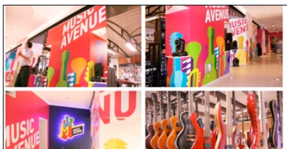
1° PREMIO CATEGORIA LOGO DESIGN MUSIC AVENUE AZIENDA: KAZMUZTORG AGENZIA: GOOD IDEA (ALMATY, KZ)