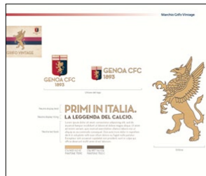
1° PREMIO CATEGORIA IDENTITY MANUAL BRAND MANUAL MERCHANDISING GENOA AZIENDA: GENOA CRICKET AND FOOTBALL CLUB AGENZIA: MELORIA COMUNICAZIONE