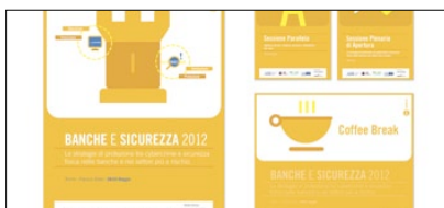
1° PREMIO CATEGORIA SYSTEM IDENTITY ABI CONVEGNI 2012 AZIENDA: ABISERVIZI AGENZIA: MOVIE & ARTS