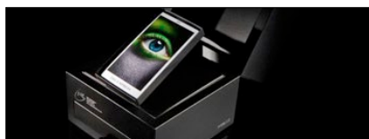
1° PREMIO CATEGORIA PROMOTIONAL ITEM DESIGN THE BLACK BOX PROJECT AZIENDA: IGGESUND PAPERBOARD AGENZIA: BRUNAZZI&ASSOCIATI (ITALIA), MARC BENHAMOU CREATIVE 360° (NEW YORK), LANDOR (FRANCIA), JEFF NISHINAKA (USA), SEBASTIAN ONUFZAK, (GERMANIA), VAN HEERTUM (OLANDA)