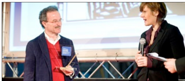
1° PREMIO BROADCAST DESIGN AND GRAPHICS INCL. ANIMATION "GFX PACK VALENTINA"