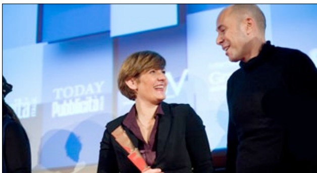
GRANDPRIX E 1° PREMIO CATEGORIA PROMOTIONAL ITEM DESIGN "COMPLEANNO STUDIO UNIVERSAL"

Tra le novità di questa diciannovesima edizione il lancio di #trofeoconcept, iniziativa indetta da RCS Sport e TVN Media Group riservata alle agenzie pubblicitarie e finalizzata all'ideazione del trofeo sostenibile da assegnare ai vincitori del XIV SuisseGas Milano Marathon.